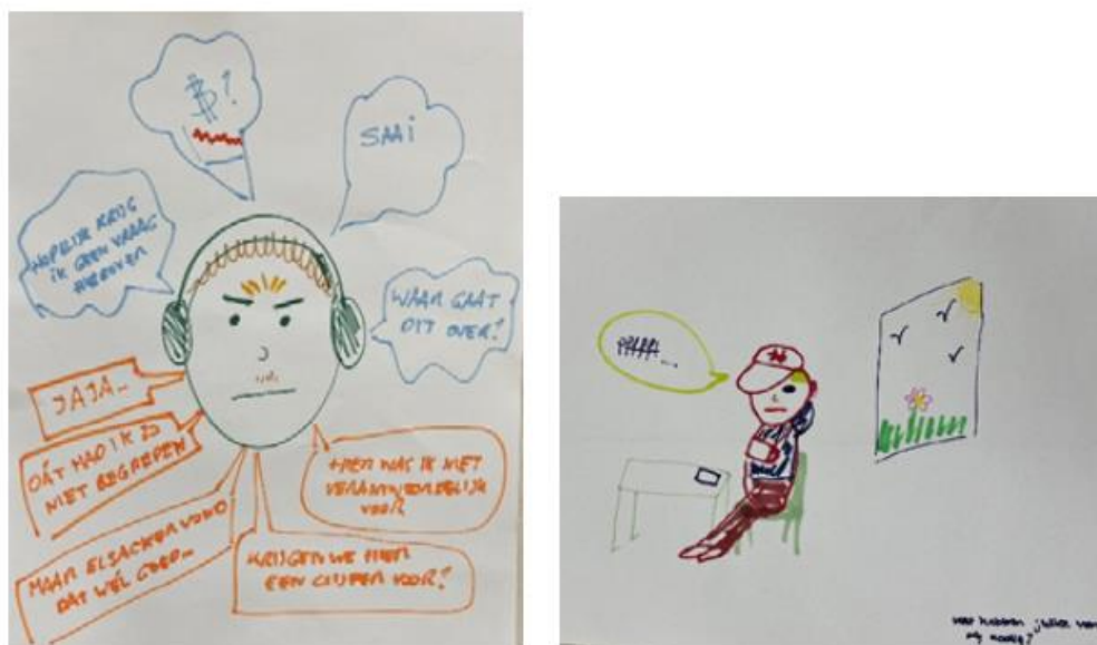
Figuur 1. Voorbeelden van tekeningen van de feedbackverwerker from hell vanuit het docentperspectief

Voorbeelden van tekeningen, afkomstig uit Leenknecht et al., 2025: